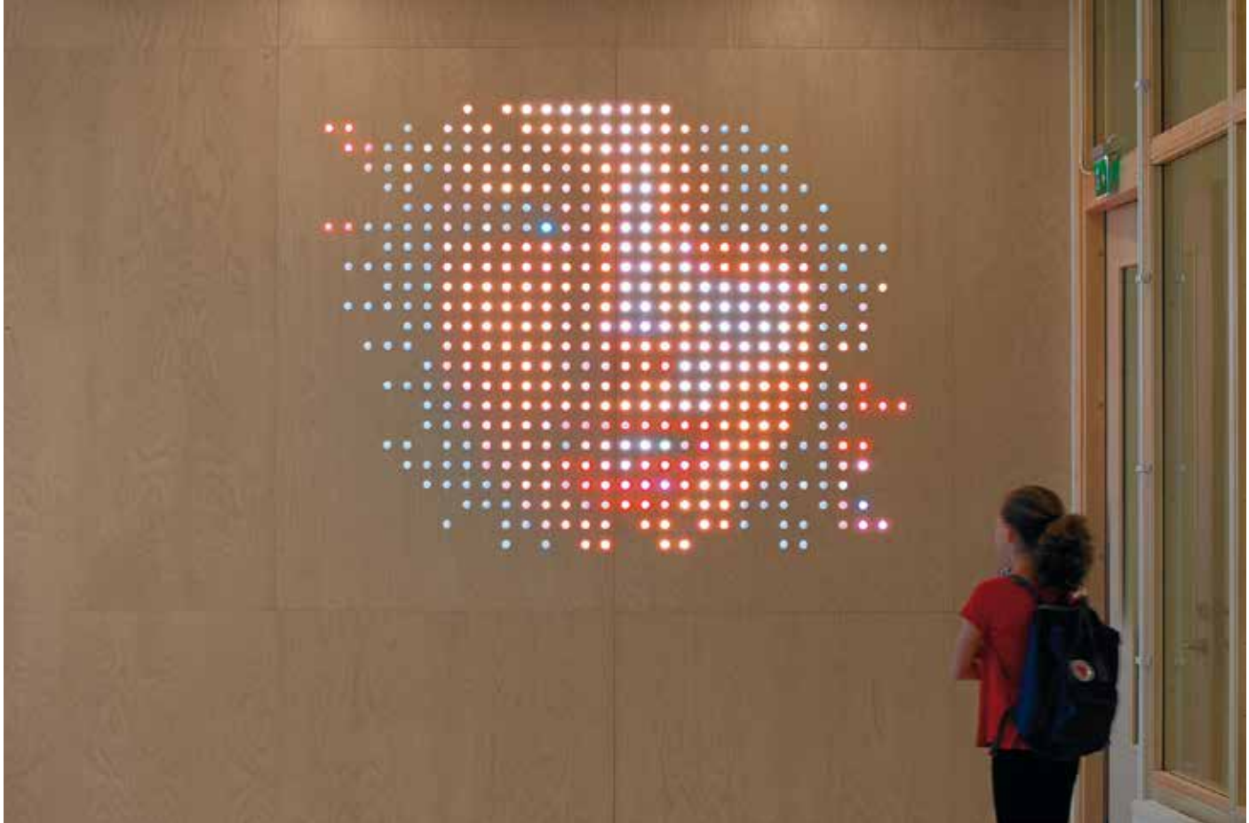
Heroes (Stockholm, 2015).