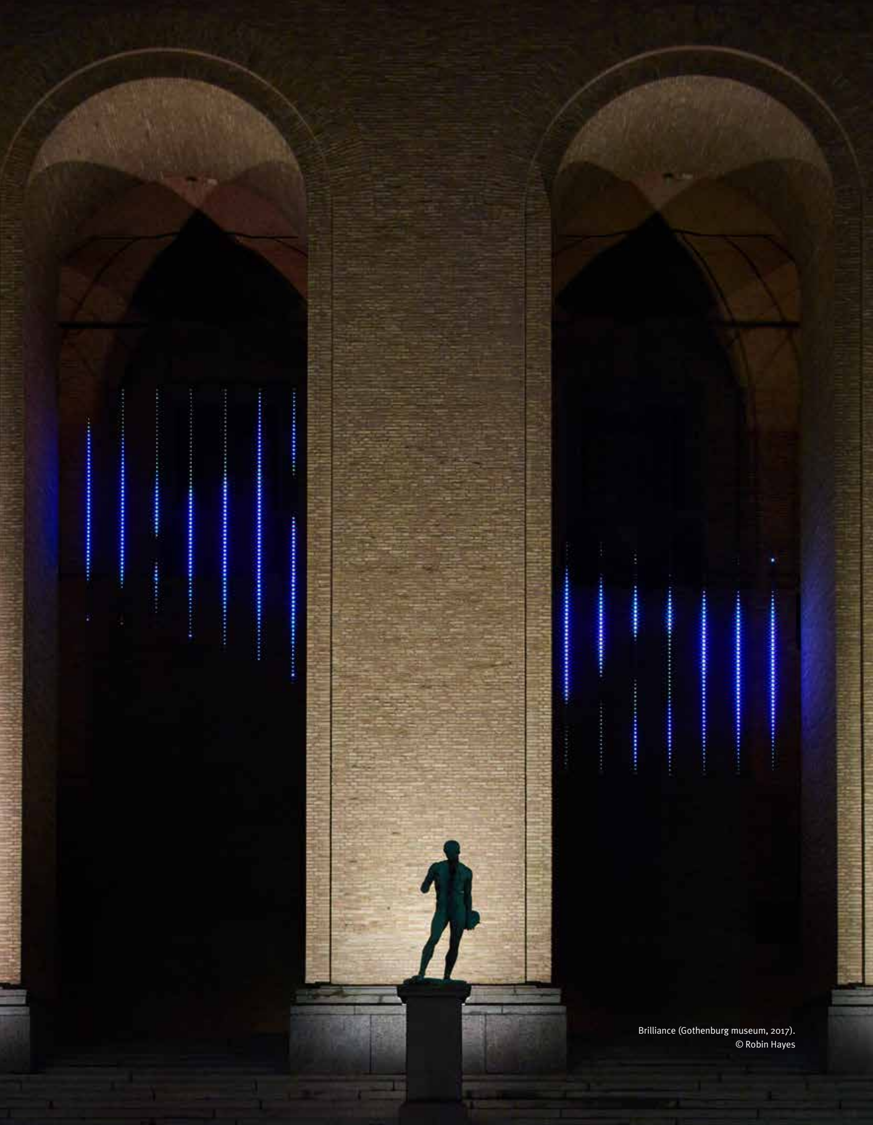
Brilliance (Gothenburg museum, 2017).