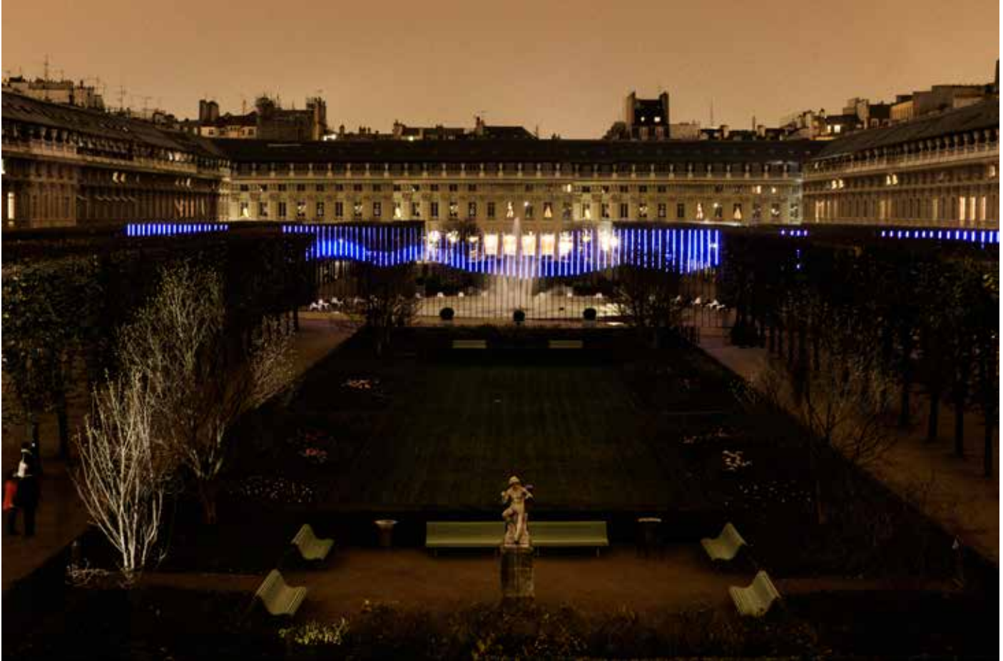
Northern Lights (Jardin du Palais Royal, Paris, 2014).

los demás, pero hoy en día me siento más segura”. Coincido plenamente con lo que dice y le pregunto si esto le da libertad a la hora de crear. “Siento que tengo experiencia y que sé de lo que hablo. La experiencia te da seguridad. Si bien todo nuevo proyecto es un nuevo reto y tengo que aprender nuevas cosas constantemente, cada vez dispongo de mayor confianza y tengo la certeza de que lo puedo conseguir. En realidad, más allá de las diferencias entre mujeres y hombres, lo que sí me ha definido es la sensación de ser siempre “la nueva”. ¡Ése es el reto!”