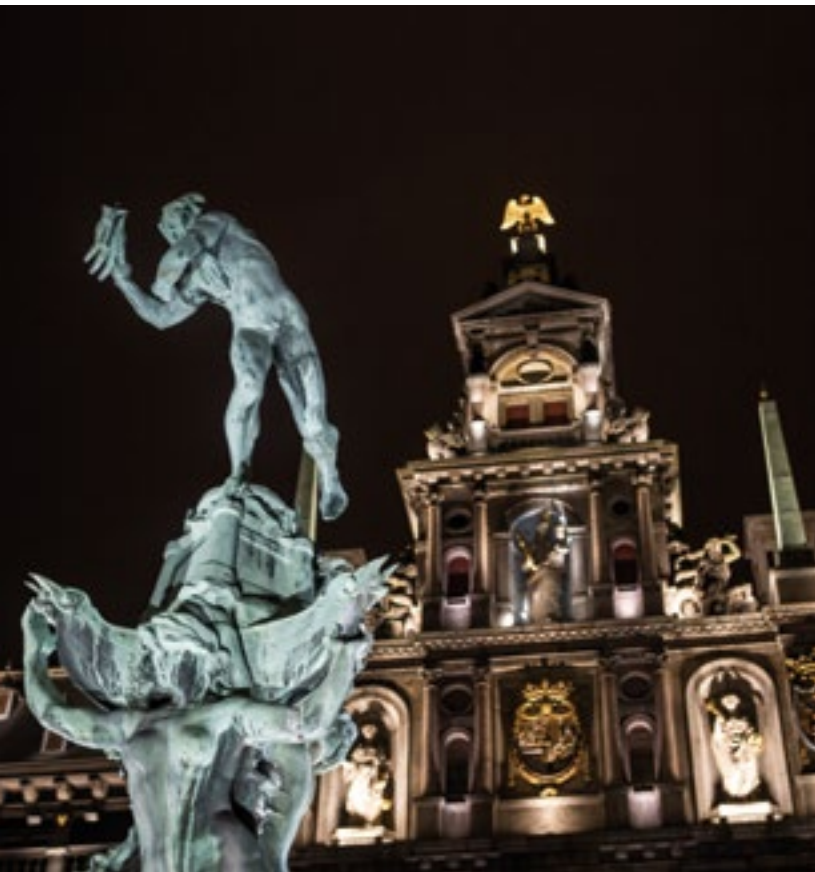
Nueva iluminación de la Grote Markt de Amberes.

estatuas y un gran presupuesto. Estudiamos todos los materiales, las soluciones... y cuando pregunté quién se encargaría de poner la iluminación, me miraron sorprendidos y me contestaron que el ingeniero eléctrico y los fabricantes de luminarias con los que trabajaban siempre. A pesar de mi insistencia y las peleas que tuvimos decidí dar un paso atrás para no molestar a mi cliente. A raíz de interesarme por la iluminación en ese proyecto, empecé a estudiarla por mi cuenta y más tarde trabajé para un diseñador que se había formado con un gran fabricante; de esta forma empezó todo”.